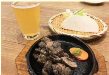
▲噛み応えはしっかりしているのに、硬くはない。香ばしい炭火焼を九州のクラフトビール「日向夏」と。お通しは生野菜を甘いお味噌でいただきます。お土産に小さいパックのお味噌がいただけました。

SHOP info 【年中無休】17時~23時 (3月中は22時までの短縮営業) 道頓堀1-7-21 中座くだおれビル3F 06-6214-0702