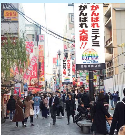
「がんばれミナミ」のパナー広告が立つ道頓堀(イメージ写真)

その趣旨で、「がんばれミナミ」「がんばれ大阪」と描いたパナー広告を商店街の街路灯4本の両面に計8枚掲出します。4月初旬からスタートする予定です。が、新型コロナウイルス撲滅のため、皆様の一致協力をなにとぞよろしくお願い致します。