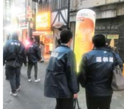
▶ わがもの顔で路上に立つバルーン型の看板。

道頓堀商店会の自主規制ルールとして、看板屋台などは道路官民境界線から80cm以内」に収めることとなっています。今後も引き続き役員会による「はみ出し看板」などの取り締まりを行ってまいりますので、皆様の協力をよろしくお願い致します。