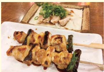
▲一番人気のももBIG串と店長おすすめ「むねタタキ」毎月28日は「にわとりの日」。限定の「鶏半身揚げ」がなんと280円! さらに「トリス」ハイボールは半額の140円で提供です。

SHOP info 【年中無休】 月~金 17時~26時 土日・祝 12時~26時 道頓堀1-6-15 コムラードドウトンビル2F 06-6212-7760