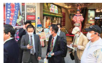
▲観光案内アプリ搭載のスマホを持って実証実験に出かける参加者。

協議会では、観光インフラの整備や魅力的なコンテンツ開発など、国内外の観光客が商店街を楽しく回遊できるような実証実験を試みていく予定です。中座くいだおれビルの地下1階「TONBORI BASE Cafe & Info」には、AI機能が搭載されていて、多言語で会話が可能な最先端デジタルサイネージも設置しています。ぜひ立ち寄りいただき、未来型の観光案内を体験してください。