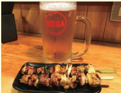
▲一番人気のもも貴族焼(たれ)とやっばりのこれ! のメガ金麦はしみじみおいしい。

SHOP info 【年中無休】17時~翌5時 道頓堀1-7-21 中座くだおれビル2F 06-6226-7988