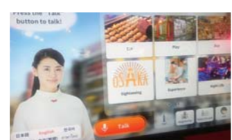
▲多言語で会話できるデジタルサイネージ。