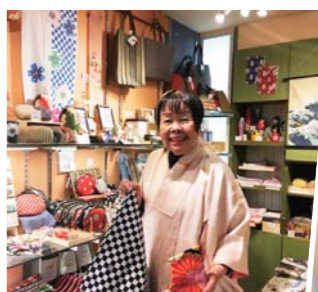
▲和をポップに表現したブランド SOUSOUの品揃えは大阪でも有数ののだとか。

絶対にやり遂げるーと決めていましたから。ここは場所がいいでしょう。千両役者たちが法善寺をそぞろ歩いた足跡を感じることが出来ます。法善寺という借景もあって、周りが庭のようです。 今ではインバウンドで海外の方や修学旅行の方にも来ていただいています。