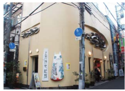
▲外壁のイエローはシェンブルン宮殿のイメージ。モダンな招き猫は撮影スポットとしても人気です。

「結婚されて、大阪に来られたのですね。」 この場所で主人と24時間営業の喫茶店をやっていました。昭和40年代は東映のヤクザ映画が大人気で、オールナイト上映しているの連日満員。「入れ替えです」とお客さんに声を掛けるのが私の仕事でした。