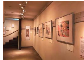
▲絵が傷まないように配慮された展示室。

「江戸とは違う」上方浮世絵の魅力はなんですかね。江戸の浮世絵は綺麗に描きけれど、太つていればそのように、鷲鼻の人は鷲鼻に、八頭身の人なんて滅多にいない。見比べて感じていただきたいですね。 絵が傷まないようにというのもある。3カ月に一度展示替えをしています。