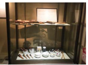
▲道具なども展示されている。