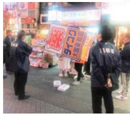
▶ 役員が看板を撤去する。

3月25日(水)の商店会定例役員会終了後、午後6時前から、役員全員で商店街に繰り出し、「はみ出し看板」の斉取り締まりを行いました。今まで何回も注意喚起やパトロールで取り締まりを行ってききましたが、その効果もあるのか、今回はややましな状況でした。しかし、相変わらず平然と看板をはみ出させたり、溢れかえるほど積んだ商品陳列台を道路に置いたり、新規の例として、バルーン型看板を道路にわがもの顔で立てていたりしました。役員が多数揃って効果的に速やかに看板、陳列台を引き上げることもありますが、店長や責任者が不在なところでは、役員自引引き上げることもありました。