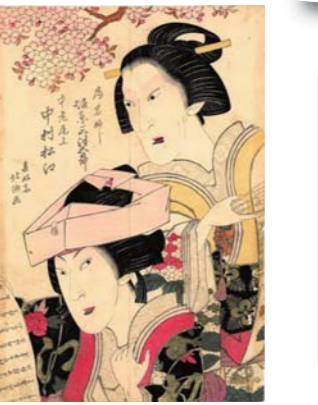
▶ 身分の高い人のお屋敷が舞台になる「御殿物」。

現在は「御殿ものご女性たち」というテーマです。 3月は武家に勤める女性がお休みをもらえるので、観劇を楽しんだようですね。 「今後、上方浮世絵館でやってみたくいですね。」 まだまだ勉強しなければいけない