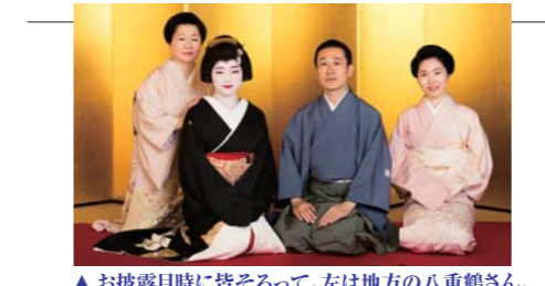
▲お披露目時に皆そろつて。左は地方の八重鶴さん。

◆たに川 〒542-0082 大阪市中央区島之内2-4-29 TEL. 06-6211-2219 tanigawa@mail.707.to