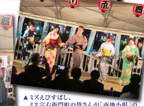
▲ミズえびすはし、ミス宗右衛門町の皆さんが「南地小唄」のワークショップに参加。