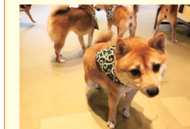
▲ 元気いっぱいの豆柴ちゃんたち。遊んで一とばかりに飛びついて来る子や、気にせずお昼寝をする子……どの子も可愛い。撮影の時はフラッシュOFFをお願いします。

【24時間営業 / 年中無休】 道頓堀1-7-21 中座くだおれビル2F 06-6484-2660