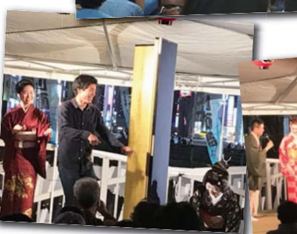
▲観客も飛び入りでお座敷遊び「とらとら」を楽しみました。