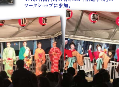
▲OSKによる着物レビュー。