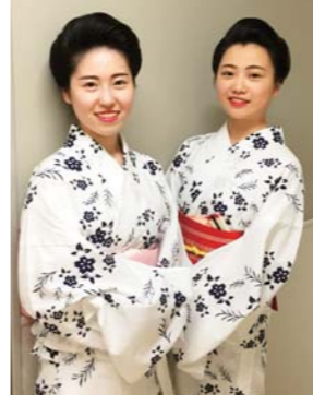
▲踊りの浴衣会での二人。