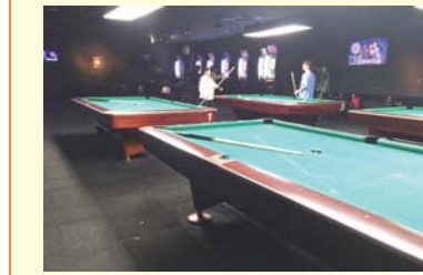
▲ 落ち着いた雰囲気ビリヤードやダーツを楽しめる。

【年中無休】 10時30分〜19時 (最終入場18:30) 道頓堀1-6-13 雛ビル2F〜4F 06-6212-7830