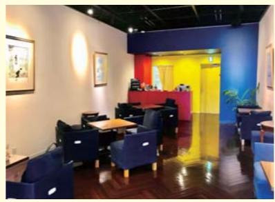
「こんな所にカフェが」と驚かれることも多いとか。

「ギャラリー香」の最上階にある正統派喫茶店。天井を高くとつた空間にイタリア製のソファが並び、おしゃれで贅沢だけれど、気取らない雰囲気のある空間。壁に飾られているのは自らフランスで購入したレイモン・ペイネの版画とポスター作品。