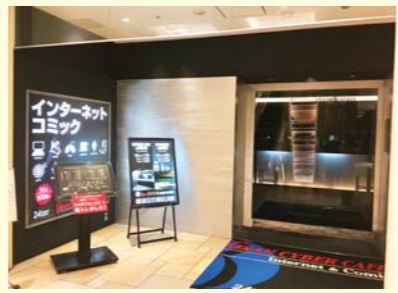
広々としたロビーカウンター。

中座くだおれビルの2階にある落ち着いた大人のネットカフェ。ドリンクやソフトクリーム、サービスマも充実。さらにスマホ充電器のレンタルやプリンターなどビジネス向けのサービスも。