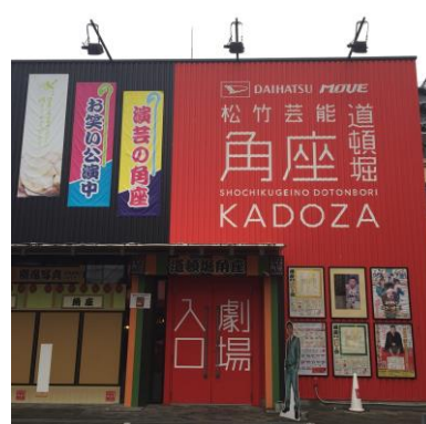
角座(外観イメージ)