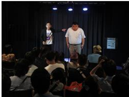
道頓堀ZAZA(お笑いLIVEイメージ)

◆対象:2018年4月1日～2019年3月31日に「エースJTB」対象商品を利用し大阪方面に宿泊のお客様