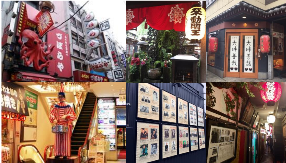
道頓堀まちあるきイメージ 上段:左から づぼらやの巨大看板、法善寺横丁の水かけ不動さん、夫婦善哉 下段:左から 中座くだおれビル、角座の松竹歴史館、浮世小路