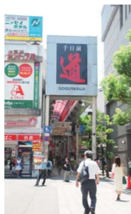
▲外国人観光客の姿が目立つ。

「かなり早くから対応していらっしゃいますね。アジアの需要を考えて、各国を回りました。非常に親日であり、また関西に注目していることに手応えを感じました。」