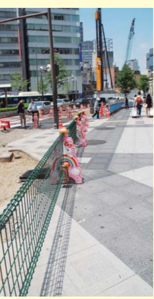
▲マルイ南側~西側道路の工事の様子。

内では歩行者と自転車が混み合う状況となっていました。そのため、東側の自動車用の側道を無くし、歩道を広げ、さらに「部」を自転車専用レーンにして、歩行者と自転車の接触事故などを減らすことを目的に工事を進めています。