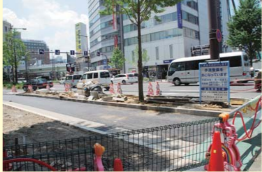
▲マルイ西側道路の工事の様子。自転車道が一部できている。