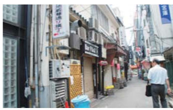
▲ここがウラなんぼの原点。

「商店街はマリンではなく、駅伝。次の世に渡したい気持ちもあります。でも大変な時ですから、もうちょっと応援しようかな、と。」