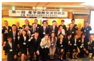
▲外国人留学生たちと幹事の皆さん。

「爆買い」はもう終わっています。買い物などの「モノ消費」から体験する「コト消費」に変わってきています。大阪をハブとして、他府県とタイアップ