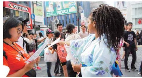
▲7月11日の記者会見では、留学生たちが浴衣を着て参加、トークセッションやピラマキの広報活動をしてくださいました。

よりインターナショナルな盆おどり 今年の盆おどりは、関西在住の留学生や観光を学ぶ大学生が広報活動や運営スタッフ、また当日の踊り手として、いろいろな場面で協力・参加してくれています。関西留学生国際交流支援連絡会や関西大学国際部に所属する留学生、大阪成蹊大学マネージメント学部観光コースの大学生の皆さんたち。「道頓堀盆おどりインターナショナル」の応援団になっていただき、ミニミと世界の架け橋の役を担っていただくよう期待しています。