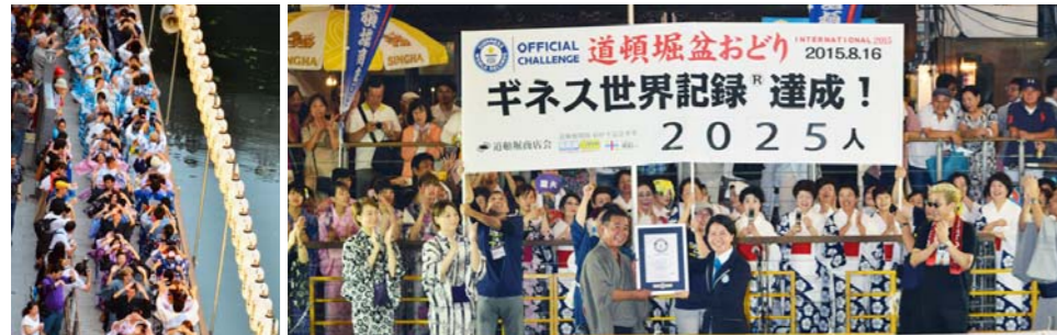
▲8月16日、「道頓堀盆おどりインターナショナル2015」では、ギネス世界記録2025人を達成、道頓堀川が熱気に包まれた。