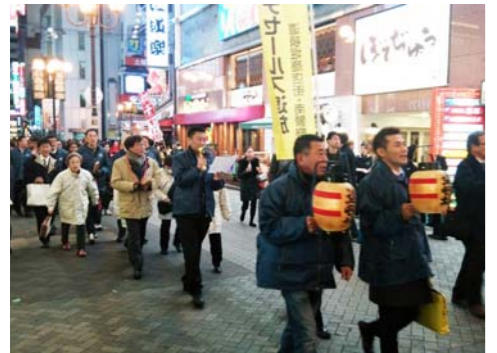
▲12月17・18・19日、道頓堀商店連盟、南警察署、中央消防署と合同で歳末の防犯・防災の夜廻りを実施した。