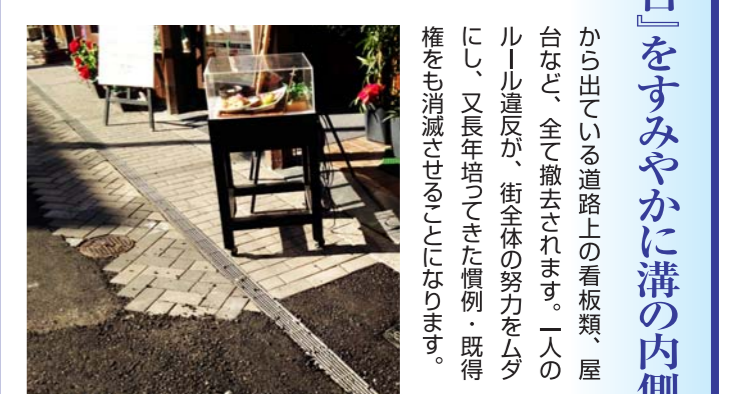
から出ている道路上の看板類、屋台など、全て撤去されます。一人のルール違反が、街全体の努力をムダにし、又長年培ってきた慣例・既得権をも消滅させることとなります。

路上にある『看板・屋台』をすみやかに溝の内側まで撤収してください！ 当商店会では「路上の看板・のぼり類・屋台などは道路官民境界線より80cm先の溝内側でとどめる」自主規制ルールを定め、秩序ある街づくりに取り組んでいます。再々のお願ひにもかかわらず、未だ一部の店舗ではルールが守られず溝をはみ出したり、道路中央までのぼり等を出すなどしています。 この状況について警察署からも違反行為として厳重注意され、「この状態が続くならば強行手段を取らざるを得ない」とも言われています。法令によって、自主ルールの「80cm」を越えるものは勿論、官民境界線