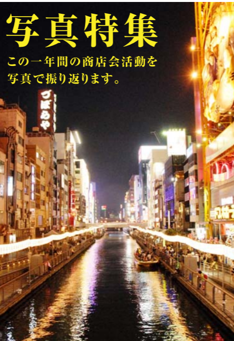
▲7月1日～8月31日の62日間、道頓堀川万灯祭を開催。道頓堀川の両岸には1300もの提灯が並び、涼しげな川情緒を楽しませた。