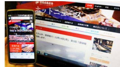
▲外国人観光客のために3か国語に訳し、店舗情報も充実、スマホにも対応した新しいホームページが3月2日にスタートした。 ▲5月25日通常総会を開催。予算・決算、一年間の活動計画などを提案、満場一致で承認された。