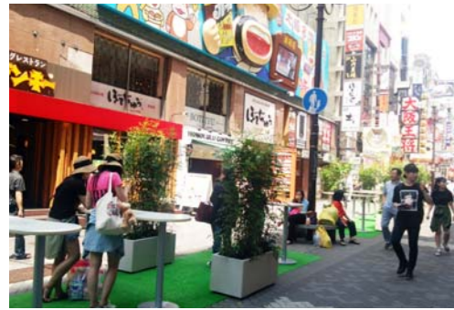
▲7月8～12日、商店街道路上にカフェテラスを設置、放置自転車禁止のマナーアップを訴える社会実験を展開した。