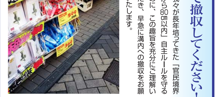
我々が長年培ってきた「官民境界線から80cm以内」自主ルールを守るために、この趣旨を充分にご理解いただき、早急に溝内への撤収をお願いいたします。