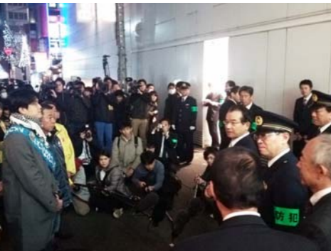
▲12月16日、ミナミの商店会などが集まって歳末防犯パトロールを実施、大阪府警本部長などから激励を受けた。