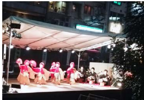
▲11月7日開催の「ミナミフェス」。相合橋と太左衛門橋の間の船上ステージでは、ミナミの伝統芸が披露され、「へらへら踊り」が復活した。