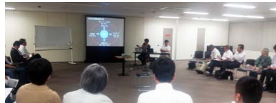
▲7月17日、道頓堀の将来を考える研究会「道頓堀500」を開催。12月まで大小の勉強会5回を開催、鋭い指摘、ユニークなアイデアなど、活発な意見が交わされた。