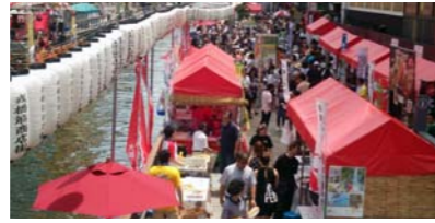
▲7月11・12日、とんぼりパワウォーク両岸で「大阪ミナミ400年祭」本祭を開催。ミナミの名店屋台を楽しみ、ドライミストの下、川床で涼む姿が印象的だった。