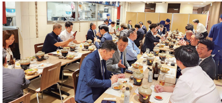
▶ 大起水産道頓堀店での会員交流会。