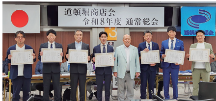
▶ 感謝状贈呈の7社の皆さま。