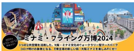
▲メインビジュアル (イメージのため、変更の可能性があります)。

※NDKとは、大阪ミナミに位置する3つの公共空間（道頓堀、御堂筋、難波駅前）に隣接する団体が、同空間を一体的に活用、歴史的な視点を踏まえ、街の魅力資源を活かしたコンテンツを創出することで、エリア価値を向上させるとともに、回遊性を高める持続的な取り組みを実施していくことを目的としています。