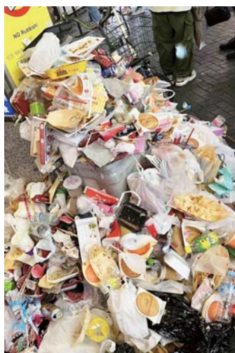
▲スマートゴミ箱設置前のゴミがゴミを呼ぶ状況。

ダンボールなどの不法投棄が増えています。以前も廃油が「缶」に入った状態で捨てられ、それが倒され大変な事態になりました。不法投棄は街を愛する人の心を踏みにじる行為であり、れっきとした犯罪です。不法投棄をした者には、法律により5年以下の懲役又は10万円以下の罰金が科せられます。「安心・安全な街」を目指す道頓堀が、そこで営業する店舗によって汚されるといふことはあってはなりません。お店の所有物やお店から出た「ゴミ」などはルールに従って、きちんと処分するようお願いいたします。監視カメラでも24時間監視しております。不法投棄が続く場合は警察に告発します。ご協力をよろしく願います。