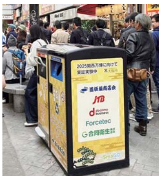
▲10セット設置されたスマートゴミ箱。

昨年11月から始まった「100Tスマートゴミ箱（略称：スマート「ゴミ箱」）」の設置により、来街者によるゴミ捨てが大幅に減りました。このスマート「ゴミ箱」は2025年大阪・関西万博が終了する2025年10月までの実証実験として、道頓堀商店会エリアに10カ所設置されま