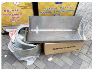
▲スマートゴミ箱周辺に不法投棄された調理器具や店舗によるゴミ。