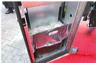
▲自動で圧縮する様子

今回の取り組みは、道頓堀商店会が所属する「道頓堀ナイトカルチャー創造協議会」が今年1月、観光拠点「レポットハウス」前に、10Tゴミ箱を約1か月間設置する実証実験を実施し、ごみの減り方を計測。期間中はポイ捨てごみの減少を確認し、集まったごみの交換など運用面においても問題ないことが確認できたことから、実証実験の期間を拡大し、さらなる検証を行うものです。検証期間は万博終了までを予定しています。