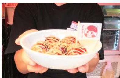
▲リユース食器イメージ。

具体的には①マイボトルが使えるマップをピポットベースにてデジタルマップ表示、②たこ焼き店にてリユース食器を選べるサービスの開始、③ペットボトルの完全分別(ボトル・ラベル・キャップ)ボックスをピポットベースに設置の3本柱で構成。「ゴミ削減の取り組みを大阪を代表する観光地から発信し、観光客の皆さまに「キレイな道頓堀」を伝えていきたいと思います。」