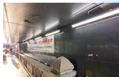
▲ライトが設置された戎橋下「通称:グリ下」。

グリコ看板の下周辺(通称:グリ下)に、3月に設置された防犯カメラに続き、新たにライトが設置されました。これまで夜は薄暗く、若者のたまり場となっており、犯罪に巻き込まれるおそれがあるなど安全面が課題となっておりました。両岸にライトが設置され、夜も明るく照らされております。安全なミニナミへまた一歩前進しました。