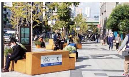
▲歩行者道で憩う人々が見られた「御堂筋チャレンジ」の1シーン。