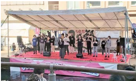
▲スポタカビル南側では「中央区にぎわいスクエア」。