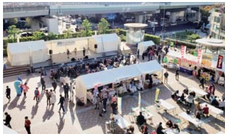
▲湊町リバープレイスでのステージショー。

11月13日・14日の二日間、「道頓堀リバーフェスティバル2021」が良い天気恵まれて行われました。湊町リバープレイスではステージと飲食ブース、道頓堀川沿岸では、「中央区にぎわいスクエア」「ほんまもんバル」の屋台村などがありました。今年は、なんば高島屋前から道頓堀までの歩行者空間をどのように回遊するかの社会実験「御堂筋チャレンジ」とも連携し、広域の開催となりました。緊急事態宣言解除後間もなくでもあり、出控えも見られましたが、大勢の人でにぎわいました。