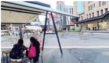
▲イス・テーブルも置かれて広場になった難波駅前。

大阪市は、2025年大阪関西万博に向け、快適に通行、憩うことができるよう、御堂筋をはじめ歩行者空間を拡げる事業を進めています。その環で、車をシャットアウトし、南海難波駅前と東側道路を歩行者天国にするものです。街の回遊性をさらに充実させ、内外からの観光客にも安全にミナミを楽しんでいただくための社会実験で、12月2日(木)まで実施します。