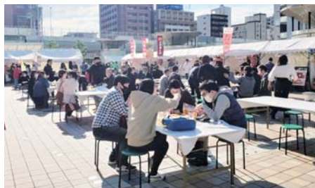
▲大阪の代表的なグルメが集まった飲食ブース。