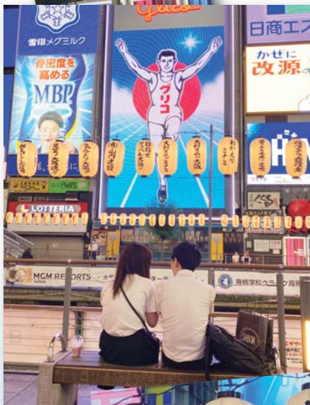
▲ グリコ前は絶好の撮影スポット。