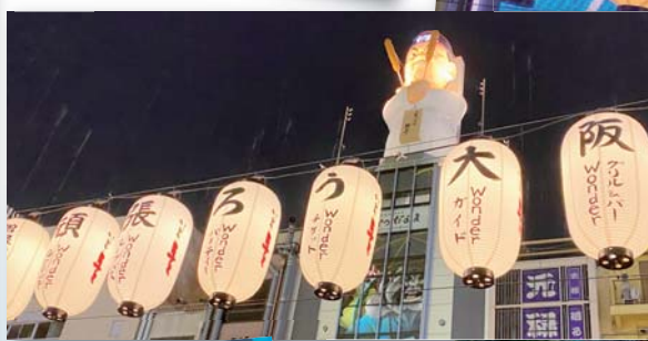
◀ だるま大臣も「頑張ろう」とエール!?