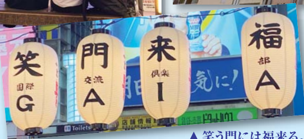
▲ 笑う門には福来る。