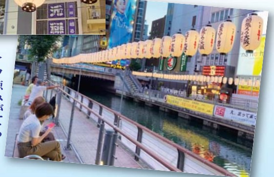
▶ 夕涼みがてら提灯の下で憩う。