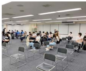
▲ 接種後経過観察席。