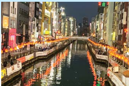
▲赤いランタンが並んだ道頓堀川の兩岸。