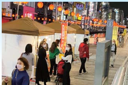
▲賑わう飲食ブース。