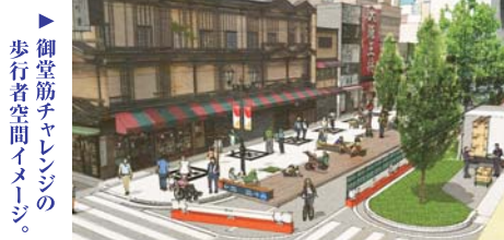
▲御堂筋チャレンジの歩行者空間イメージ。