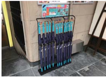
▲ 千房道頓堀ビル店前。