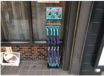
▲ はり重カレーショップ前。