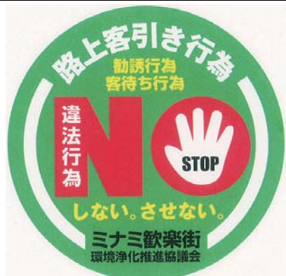
各会員に配布するワッペン。

全国で最も厳しいとされる大阪市の客引き禁止規制が始まりました。来街者に執拗にまとわりつく客引きは、大阪の顔というべき道頓堀のイメージダウンです。禁止区域の指定以来、悪質な客引きは徐々に減ってきているようです。区域内では、自店舗の敷地から1メートル以内なら客の呼び込みは許されますが、それを超えて客引き【客引き目的で路上にたむろする、風俗店などに勧誘するスカウトなどの行為】が完全に禁止されます。