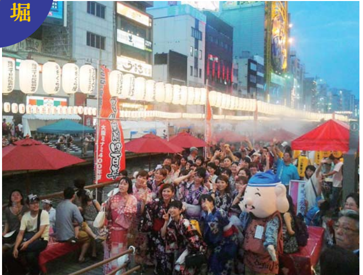
▲7月12日~13日 大阪ミナミ400年祭イベント 道頓堀川夏祭り。7月13日、「浴衣でミナミ ナイトツアー」に参加した女性たちが記念撮影。