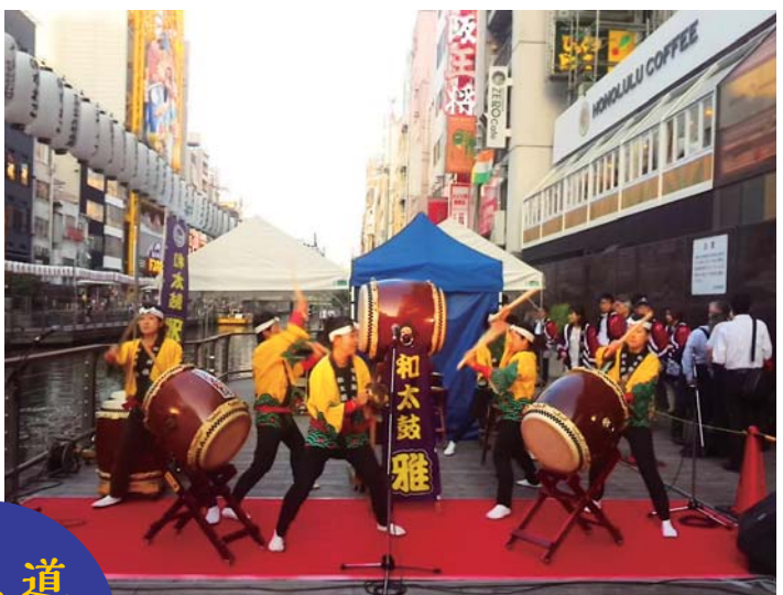
▲7月1日、万灯祭点灯セレモニー。