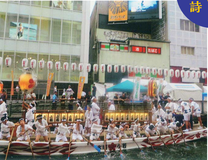
▲7月13日、難波八阪神社夏祭りの船渡御が道頓堀川を力強くこぎ行きます。